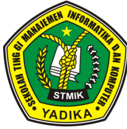
Gambar 1.1 Lambang STMIK Yadika Bangil

STMIK YADIKA Bangil - Pasuruan memiliki bendera atau Panji yang berbentuk persegi panjang dengan perbandingan ukuran 2 : 3, terbuat dari kain saten tebal berwarna dasar hijau yang pinggirannya diberi rumbai berwarna emas dan ditengah-tengah bendera terdapat lambang STMIK YADIKA.