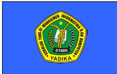
Gambar 1.3 Bendera/Panji Program Studi Teknik Informatika

Bendera Jurusan (Program Studi) Teknik Informatika memiliki bendera atau Panji yang berbentuk persegi panjang dengan perbandingan ukuran 2 : 3, terbuat dari kain saten tebal berwarna dasar biru yang pinggirannya diberi rumbai berwarna emas dan ditengah-tengah bendera terdapat lambang STMIK YADIKA.